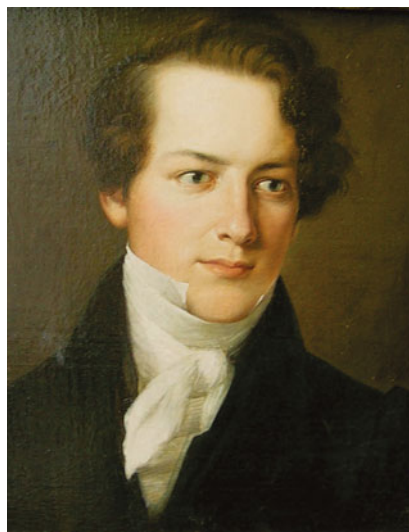
Портрет графа Томаша Потоцкого. 1841. Иркутский художественный музей

академии наук с 1809 года (4). Был хозяином широко известного петербургского литературно-художественного салона – места встреч деятелей литературы и искусства. Входит в число знаменитых людей Санкт-Петербурга (5). Похоронен в Некрополе мастеров искусств Александровской лавры вместе с супругой Елизаветой Марковной.