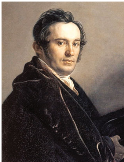
Портрет В.И. Григоровича. 1818 г. Государственный Русский музей