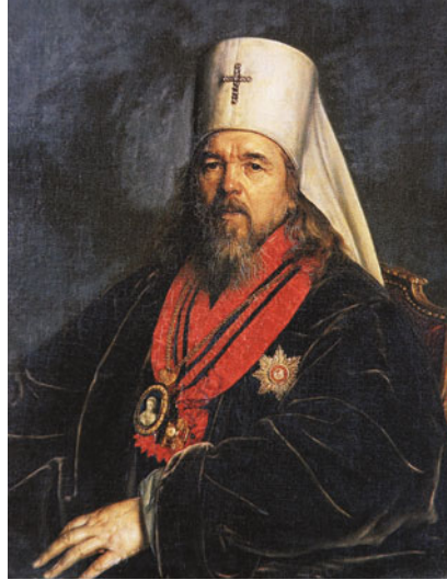
Портрет митрополита Серафима. После 1821 г. Государственный Эрмитаж