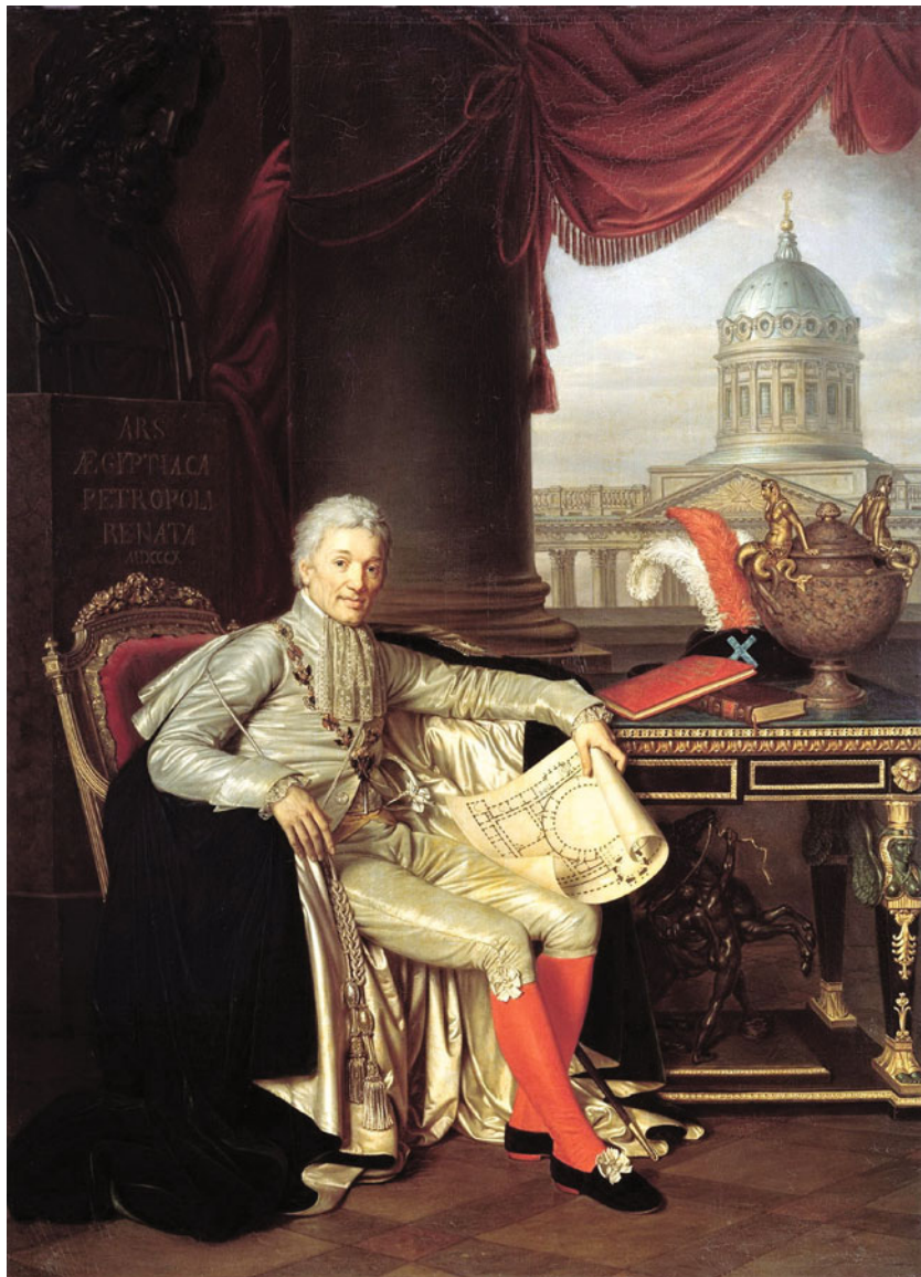
Портрет президента Академии художеств графа А.С. Строганова. 1814 г. Государственный Русский музей

В монографии В.С. Турчина, а также в некоторых биографических заметках, посвященных художнику-портретисту Александру Григорьевичу Варнеку (1782–1843), имеются краткие определения категорий тех людей, которых он изображал на своих портретах (1–3). Так, в аннотации названной книги говорится, что «она воссоздает облик талантливого живописца, одного из лучших портретистов пушкинской