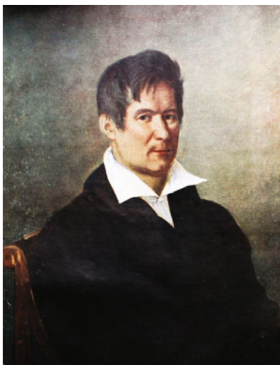
Портрет архитектора В.П. Стасова. 1820-е гг. Государственный Русский музей