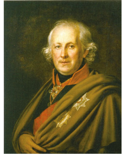
Портрет адмирала Н.С. Мордвинова. Ок. 1812 г. Государственный Эрмитаж

а в 1834 году был удостоен звания заслуженного профессора. Один из основоположников романтизма в русской живописи. Входит в число знаменитых людей Санкт-Петербурга (5). Похоронен в Некрополе мастеров искусств Александрово-Невской лавры. В начале XX века входил в число 100 наиболее известных деятелей русского искусства (2).