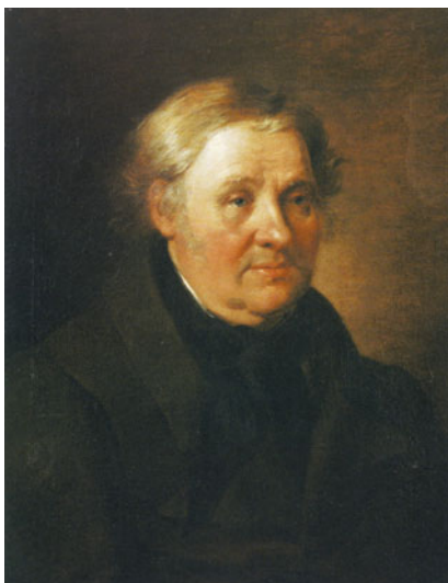
Портрет художника Т. Ф. Дурнова. Астраханская картинная галерея