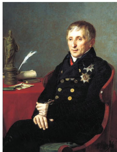
Портрет президента Академии художеств А.Н. Оленина. Ок. 1820 г. НИМ РАХ

Карамзин Николай Михайлович (1766–1826), выдающийся русский писатель, историк и историограф, автор 12-томной «Истории государства Российского». Почетный член Российской академии наук с 1818 года (4). Входит в число знаменитых людей Санкт-Петербурга, самых знаменитых россиян и самых знаменитых историков России (5–7). Похоронен вместе с супругой в Некрополе мастеров искусств Александрово-Невской лавры.