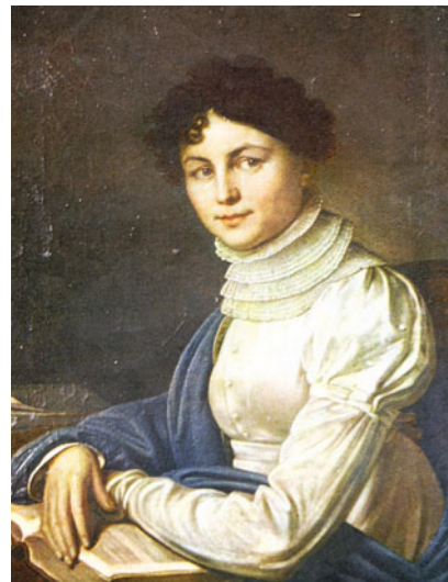
Портрет поэтессы А.П. Буниной. Ок. 1825 г. Литературный музей им. А.С. Пушкина

Лабзин Александр Федорович (1766–1825), известный писатель,