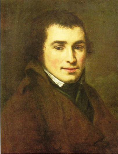
Портрет художника А.В. Ступина. 1804 г. Государственная Третьяковская галерея