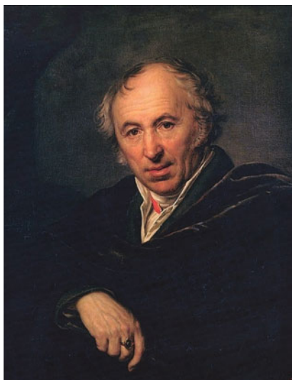
Портрет скульптора И.П. Мартоса. 1819 г. НИМ РАХ