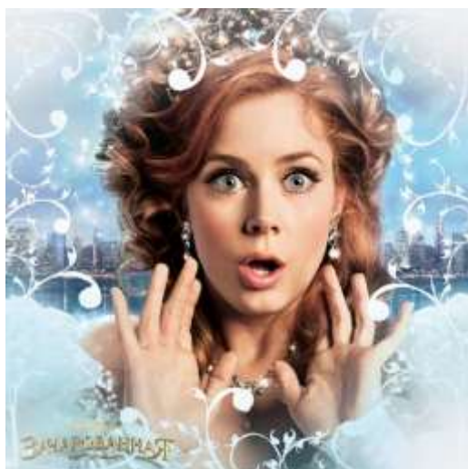
Свидетельница непорочного зачатия.