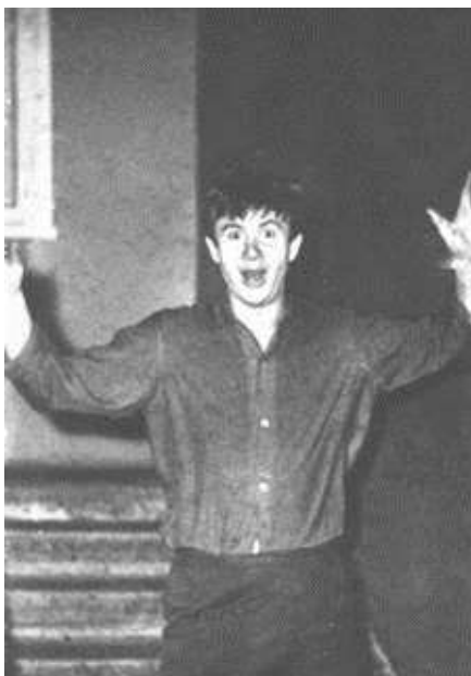
Очевидец непорочного зачатия. (Прометасс №2)